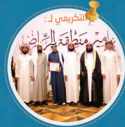
رئيس الجمعية و الأساتذة مع الفائز