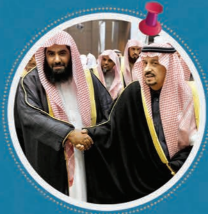
أمير منطقة الرياض مع رئيس الجمعية