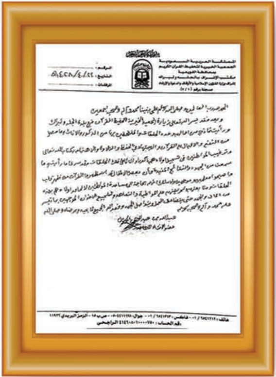
صاحب السمو الملكي الأمير تركي بن طلال بن عبدالعزيز آل سعود أمير منطقة عسير