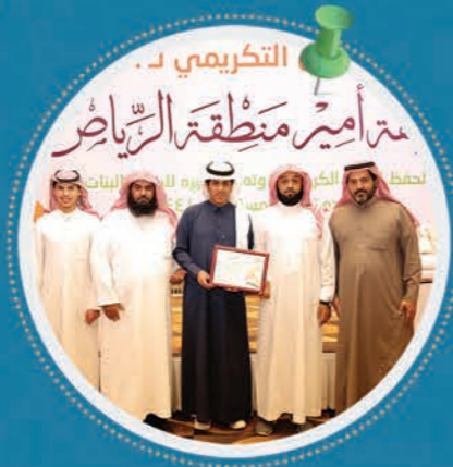
الأساتذة مع الفائز