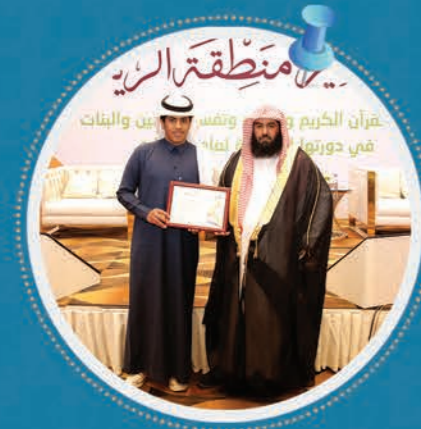
رئيس الجمعية مع الفائز