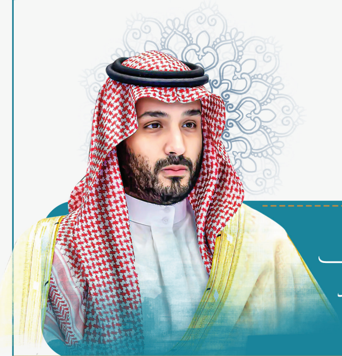
صاحب السمو الملكي

الأمير محمد بن سلمان بن عبدالعزيز آل سعود